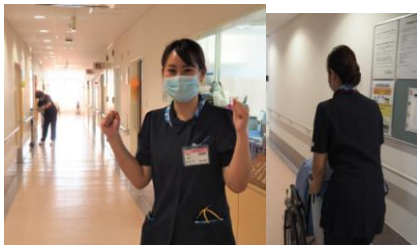
「まだ緊張はしますが、日々看護って楽しい!と感じながら頑張ってます!!」