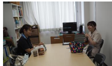
ホッとひとときランチタイム この時ばかりは仕事を離れて世間話