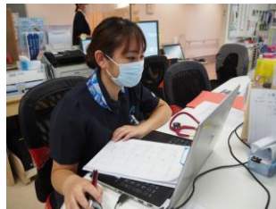
電子カルテにも慣れました♪