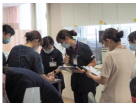
先輩に混ざって 保清ケアの打合せ♪