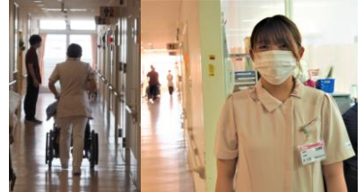
「毎日緊張の連続ですが、先輩に見守られながら頑張ってます!!」