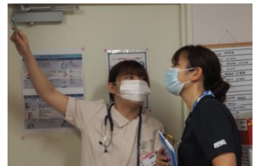
患者さんのスケジュール確認中!!