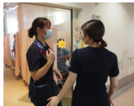
困っていると先輩からのやさしい声をかけが・・・♪